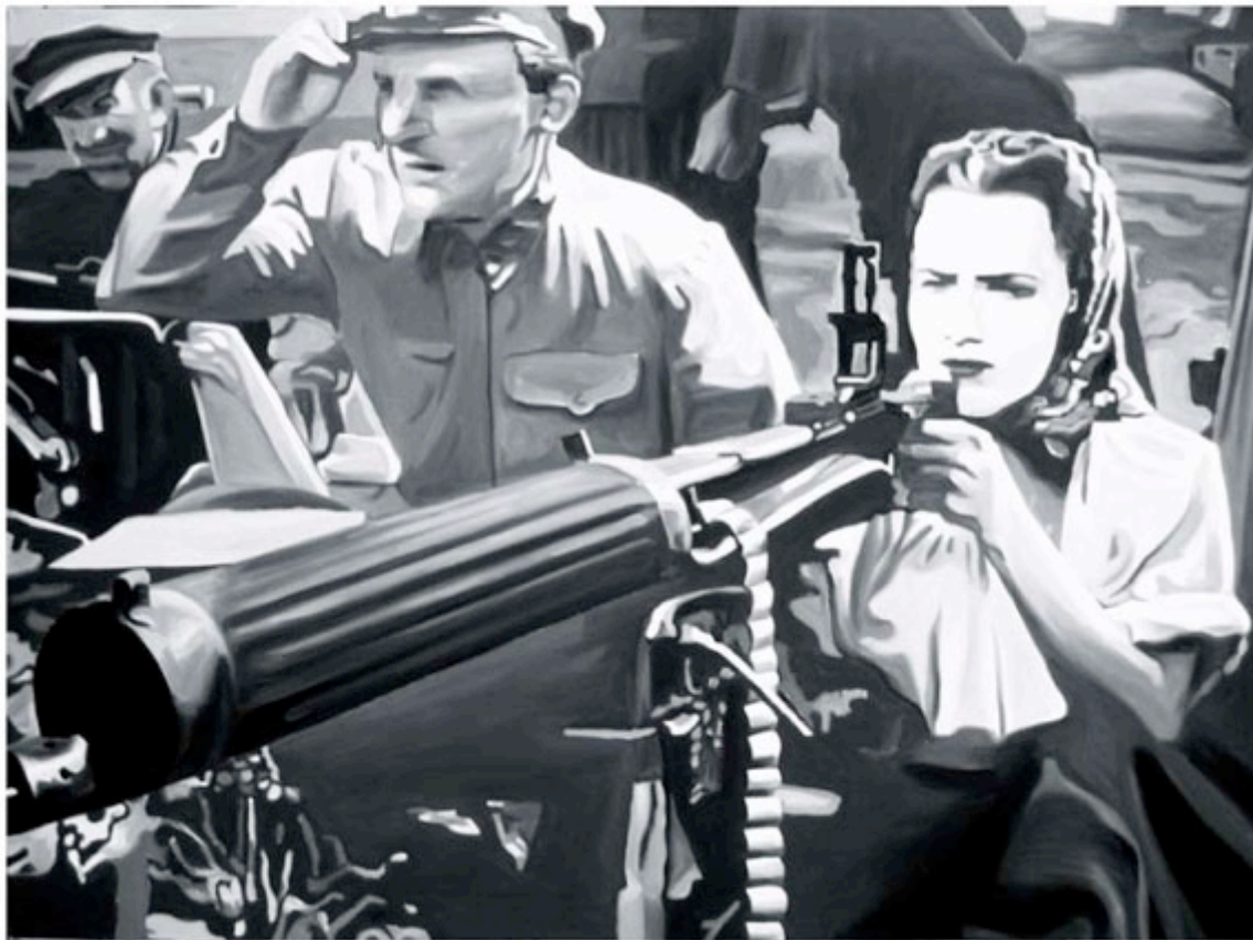
Song of Russia N°1

Du 17 janvier au 21 février 09 - Galerie Blue Square - Paris